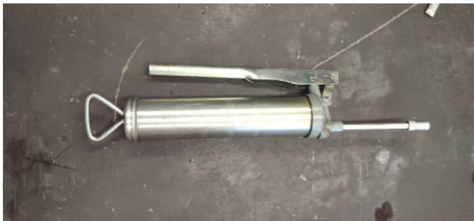
Шприц для заливки масла